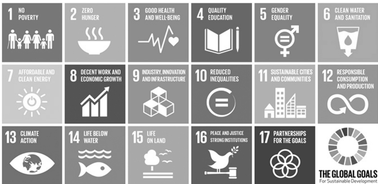
รูปที่ 1 เป้าหมายการพัฒนาอย่างยั่งยืน (Sustainable Development Goals: SDGs) ที่มา : www.un.or.th/globalgoals/th/the-goals/