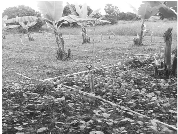
คูน้ำรอบพื้นที่เกษตรระบบน้ำหยดภายในพื้นที่