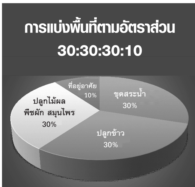
รูปที่ 2 การจัดแบ่งพื้นที่เป็น 4 ส่วน ในอัตราส่วน 30:30:30:10 ตามทฤษฎีใหม่ขั้นต้น

(2) ทฤษฎีใหม่ขั้นที่สอง เน้นการรวมพลังกันในรูปแบบกลุ่ม สหกรณ์ เพื่อสร้างการร่วมแรงร่วมใจกันทั้งทาง (ก) ด้านการผลิตต้องร่วมมือกันจัดหาพันธุ์พืช การเตรียมดิน การจัดหาปุ๋ย ชลประทานฯ เพื่อการเพาะปลูก (ข) ด้านการตลาดต้องร่วมมือกันเตรียมการต่างๆ เพื่อขาย