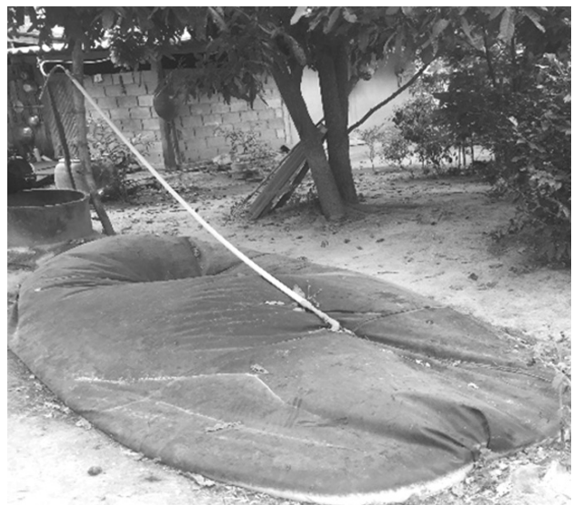
หลุมก๊าซชีวภาพ