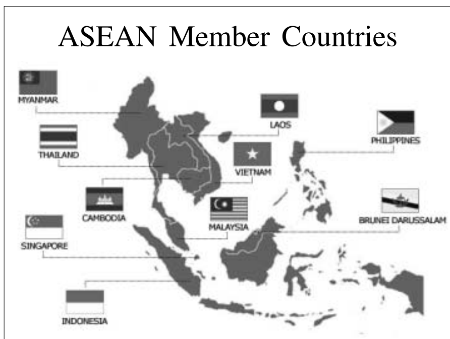
ภาพที่ 1 ประเทศสมาชิกอาเซียน

หลังการประกาศจัดตั้งประชาคมอาเซียน ก่อให้เกิดความร่วมมือระหว่างประเทศสมาชิกทั้ง 10 ประเทศ ซึ่งประกอบด้วย สาธารณรัฐอินโดนีเซีย สาธารณรัฐฟิลิปปินส์ สาธารณรัฐสิงคโปร์ สาธารณรัฐแห่งสหภาพเมียนมาร์ สาธารณรัฐประชาธิปไตยประชาชนลาว สาธารณรัฐสังคมนิยมเวียดนาม สหพันธรัฐมาเลเซีย บรูไนดารุสซาลาม ราชอาณาจักรกัมพูชา และราชอาณาจักรไทย โดยมีความมุ่งหวังเพื่อยกระดับการพัฒนา ประเทศต่าง ๆ ในประชาคมอาเซียนล้วนปรับเปลี่ยนแนวทางการพัฒนาจากเดิม ที่ดำเนินการยื่นหยัดอย่างปัจเจก ซึ่งเป็นที่ยอมรับว่ามีความเสี่ยงต่อการเปลี่ยนแปลง โดยเฉพาะกับประเทศหรือกลุ่มประเทศที่มีอำนาจการต่อรองสูง ซึ่งสภาพดังกล่าวไม่ต่างจาก “ไม้ซีกงัดไม้ซุง” สู่การพัฒนาแบบ “รวมกันเราอยู่ แยกกันเราตาย” โดยการประสานความร่วมมือในลักษณะแบบบ้านพี่เมืองน้อง เสริมสร้างเสถียรภาพความมั่นคงภายใต้พลวัตของสถานการณ์โลกที่มากไปด้วยการแข่งขัน การช่วงชิงโอกาสและผลประโยชน์